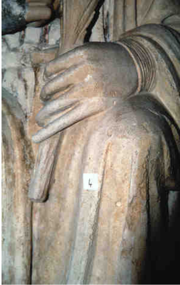
Photo 3 : atténuation de la teinte jaune, après nettoyage laser, par application de compresses d'eau dans la partie basse de l'image, restauration du portail central de la façade ouest de la cathédrale Notre Dame de Paris.

Le laser serait l'outil idéal pour nettoyer les polychromies, les peintures murales... s'il ne modifiait pas la couleur de nombreux pigments anciens. Des recherches sont en cours dans les laboratoires pour comprendre les mécanismes de ces décolorations en espérant pouvoir un jour y remédier. D'autres lasers sont testés ou avec des impulsions de durée plus courtes, de l'ordre de la femtoseconde ( 10^{-15} seconde). En attendant, il faut au moins réaliser des essais ponctuels préalables avant de se lancer dans le nettoyage d'une couche de peinture.