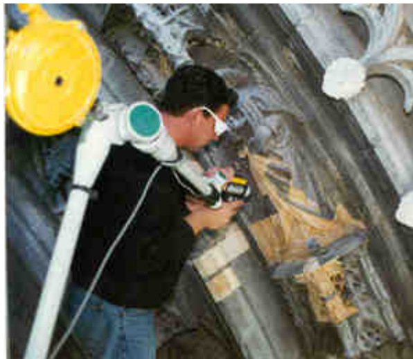
Photo 2 : essai de nettoyage laser en cours sur un claveau sculpté dans le cadre de l'étude préalable à la restauration du portail nord de l'église Saint Michel de Bordeaux.

Le laser n'a pas remplacé toutes les méthodes de nettoyage, mais il est venu enrichir la panoplie du restaurateur de sculptures qui dispose actuellement de nombreuses autres techniques de nettoyage : micro sablage, compresse, brossage doux, outillage à main. La nature des salissures, la présence de vestiges de polychromie, de couches de traitement ancien peuvent influencer le choix final [11]. Des essais comparatifs sur des zones-test (photo 2) sont recommandés [12]. Par ailleurs, le nettoyage laser ne peut enlever les recouvrements biologiques (mousses, lichens, algues), les dépôts de poussières meubles, et les taches d'imprégnation (encre graffiti...). Pour ces cas, on aura respectivement recours à un traitement biocide, à un brossage associé à une aspiration et à l'application de solvants dans des compresses.