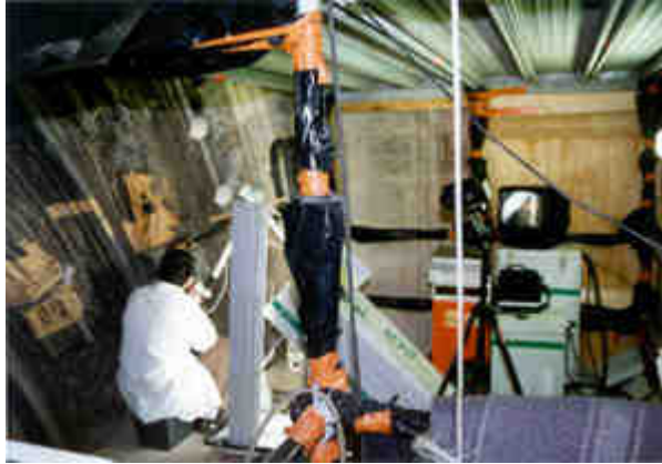
Photo 4 : intérieur de l'aire de travail sur un chantier de nettoyage laser, restauration du portail nord de l'église Saint Michel de Bordeaux.

Par ailleurs, comme pour toute opération de nettoyage, le restaurateur porte un masque anti-poussière pour éviter d'avalier ou d'inhaler de fines particules dangereuses pour sa santé. Dans le même ordre d'idée, mais aussi pour éviter que les salissures ne se redéposent à proximité, un aspirateur puissant est souvent braqué vers la zone en cours de nettoyage.