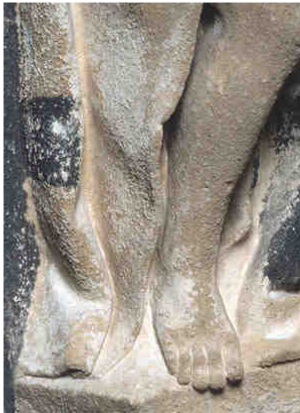
Photo 1 : nettoyage laser d'une sculpture (statuaire, portail nord de l'église Saint Michel de Bordeaux) couverte d'une croûte noire indurée mais à l'épiderme rendu très fragile par l'altération. On note en particulier de fines écailles de pierre soulevées. Avec le laser, un nettoyage de grande qualité, respectueux de la surface sculptée est possible sans consolidation préalable.

Le laser n'utilise que de l'énergie lumineuse, sans eau (nébulisation, compresses), sans produits chimiques (bases, acides, complexants...), sans particules abrasives (micro-abrasion) et sans pression. Sur des surfaces fragiles, écaillées, pulvérulentes, prêtes à tomber, il est ainsi possible de nettoyer des croûtes noires indurées sans aucun risque (photo 1).